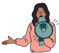
DEFENSOR DEL PUEBLO

Cualquier ciudadano puede acudir al Defensor del Pueblo y solicitar su intervención, que es gratuita, para que investigue cualquier actuación de la Administración pública española o sus agentes, presuntamente irregular.