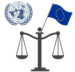
TRIBUNAL EUROPEO DE DERECHOS HUMANOS ( TEDH)

Esta es la máxima autoridad judicial de Europa para la garantía de los derechos humanos y libertades fundamentales.