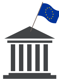
TRIBUNAL DE JUSTICIA DE LA UNIÓN EUROPEA

Este tribunal garantiza que se aplique la legislación de la UE de la misma manera en todos los países miembros. En determinadas circunstancias, también pueden acudir al Tribunal los particulares, las empresas y las organizaciones que crean vulnerados sus derechos por una institución de la UE.