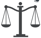
JUZGADO DE GUARDIA

Mucha gente no lo sabe, pero en los Juzgados de Guardia de España se puede poner también denuncias.