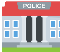
UNIDAD DE GESTIÓN DE DELITOS DE ODIOS.

En cada Comunidad Autónoma hay una comisaría especializada en delitos de odio. Localiza la de tu ciudad.